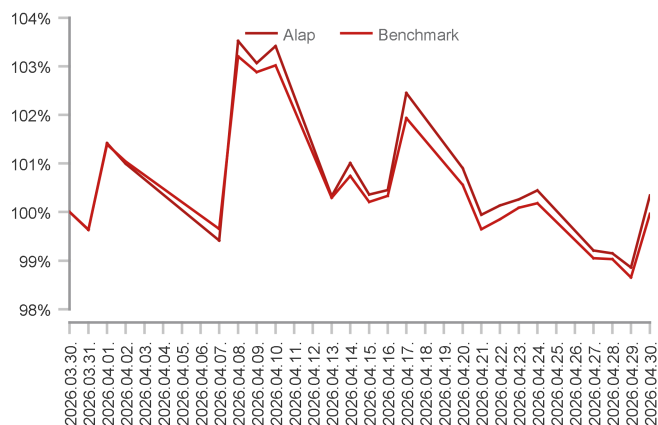
Az alap teljesítménye az elmúlt 1 hónapban