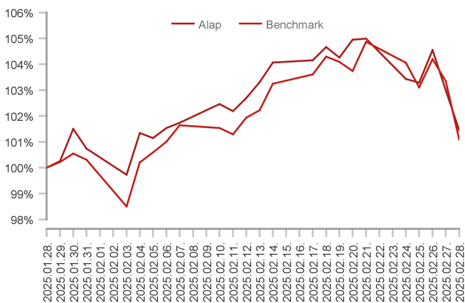
Az alap teljesítménye az elmúlt 1 hónapban

Február elején már bevezetésre került egy 10%-os ráta, amelyet várhatóan további emelések követhetnek. A fogyasztás nem kellő mértékű növekedését tükrözi a februári deflációs adat: -0,7%-on alakult az árszínvonal emelkedése, emellett évtizedes mélyponton van a consumer confidence index is. Mindezek fényében a Kínai Shanghai Comp 2,16%-ot növelt, habár továbbra is kérdés, hogy a befektetők hogyan értékelik a számos gazdasági beavatkozást, illetve hogyan reagálnak a kereskedelmi vámokra. Az MSCI Emerging Markets indexe, amely a világ feltörekvő piacait tömöríti közel 1,05%-ot emelkedett a februári jegyzés során, miközben az indiai SENSEX 2,76%-ot esett. Az MSCI MXFEJ (Távol-keleti) indexe több, mint 3,17%-ot emelkedett, míg a Latin-Amerikát tömörítő MSCI Latam index 0,15%-ot ment felfele egyetlen hónap alatt. A hongkongi piac teljesítményét tükröző HSI index 13,59%-ot emelkedett, miközben az indiai SENSEX 2,76%-ot esett. Az indiai Nifty 2,92%-ot zuhant, miközben a tajvani TWSE 1,51%-ot rallyzott ugyanezen időszak alatt. Emellett komoly növekedésen ment keresztül a koreai KOSPI index a maga 7,28%-os gyarapodásával. Ugyanakkor a CETOP 8,26%-ot emelkedett. A Fejlődő Alap USD sorozata 0,7%-ot emelkedett a hónap során.