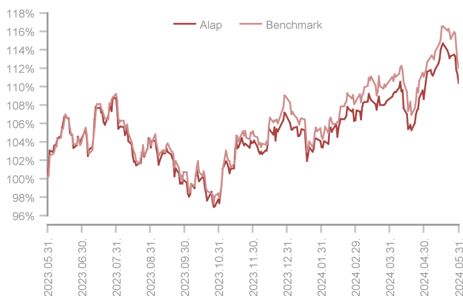
Az alap teljesítménye az elmúlt 12 hónapban