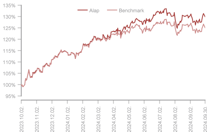
Az alap teljesítménye az elmúlt 12 hónapban