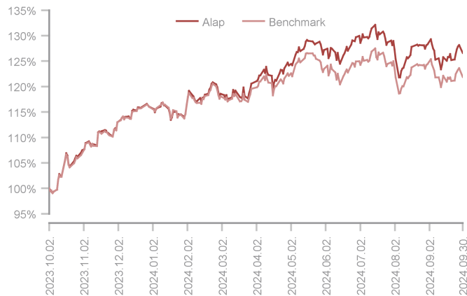
Az alap teljesítménye az elmúlt 12 hónapban