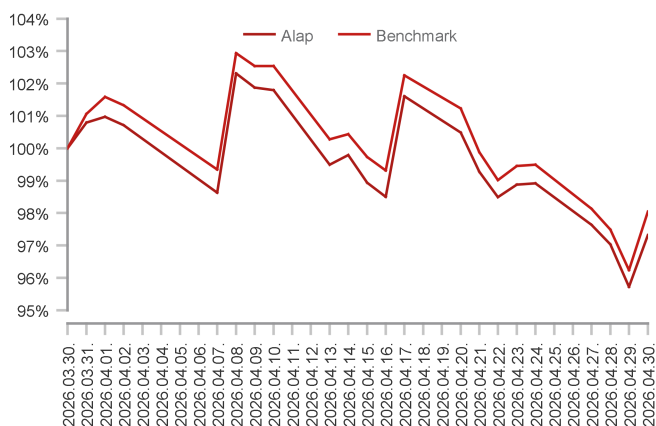
Az alap teljesítménye az elmúlt 1 hónapban

Másodszor: az EKB szintén nem változtatott a monetáris kondíciókon, mivel az inflációs és növekedési kockázatok egyszerre erősödtek. Harmadszor: a feltörekvő piacok teljesítménye kiemelkedő volt, amit különösen az ázsiai technológiai részvények támogattak. Negyedszer: Magyarország esetében a Magyar Nemzeti Bank változatlan kamatszint mellett a kockázati prémiumok csökkenését és a forint erősödését emelte ki. A befektetési következtetés röviden az, hogy az áprilisi rali erős volt, de a makrogazdasági környezet nem vált érdemben stabilabbá. Az inflációs bizonytalanság, az energiaár-sokk és a geopolitikai kockázatok miatt a hónap végi állapot inkább egy erős, de sérülékeny visszapattanásnak tekinthető, mintsem egy teljesen kitisztult új emelkedő trend kezdetének.