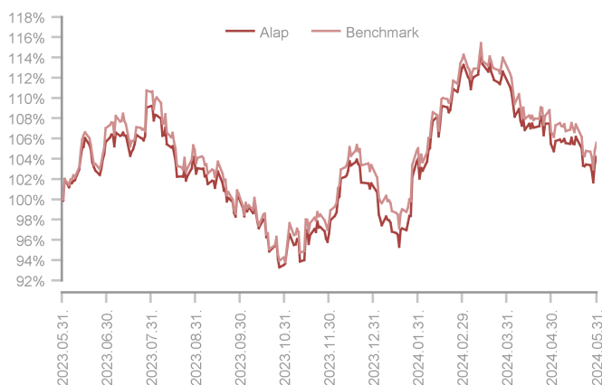
Az alap teljesítménye az elmúlt 12 hónapban