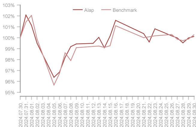
Az alap teljesítménye az elmúlt 1 hónapban

Az indiai adatokat vizsgálva kedvezőbb képet látunk, az infláció 5%-ról 3,5%-ra csökkent, a kompozit beszerzési menedzser index 60,7 pontos értéke jelentős bővülésről árulkodik, a második negyedéves GDP növekedés pedig 6,7% volt. Érdeemes megemlíteni a japán yent, amely az év egyik leggyengébb devizája lett a hatalmas short pozíciók eredményeként, azonban a Bank of Japan monetáris szigorításának köszönhetően ezen a fronton komoly változásokat láthattunk, a közel 161-es tartományból egészen 141-ig csökkent az árfolyam a yen javára a hónap elején tapasztalt turbulencia közepette. A hatalmas volatilitás (amekkora utoljára 2020 márciusában volt) komoly meglepetést okozott minden piaci szereplőnek. Az események hátterében valószínűleg a japán devizában több év alatt felépülő short pozíciók hirtelen zárása állt, amely pár nap leforgása alatt 152-ről egészen 141-ig rallyzott a dollárral szemben. A Fejlődő Alap forintos sorozata augusztusban 1,92%-ot csökkent.