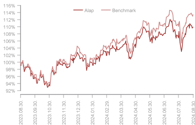
Az alap teljesítménye az elmúlt 12 hónapban