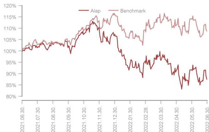
Az alap teljesítménye az elmúlt 12 hónapban