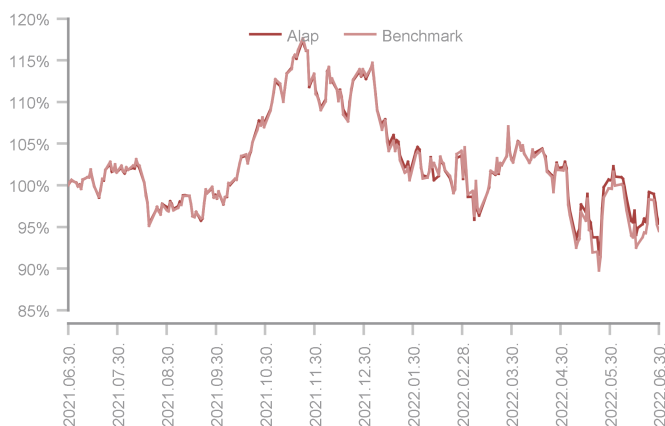
Az alap teljesítménye az elmúlt 12 hónapban